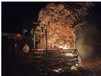
【10日】ほっけんぎょう