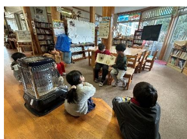
【22日】図書委員会読み聞かせ