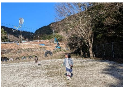
【22日】生活科「たこあげ」